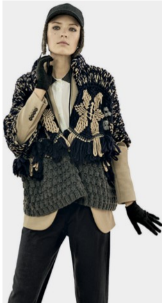
▶ Ricami Il cardigan di Brunello Cucinelli è lavorato a intarsi