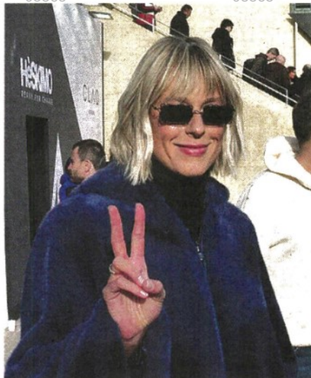
Federica Pellegrini è stata protagonista di Pitti ieri nello stand di Jacket, che dopo aver realizzato il costume dei record ora le dedica la linea di piumini e tute con lei testimonial per un anno. La vita da sposata? «Sono felice, ma per il figlio c'è ancora un po' di tempo»