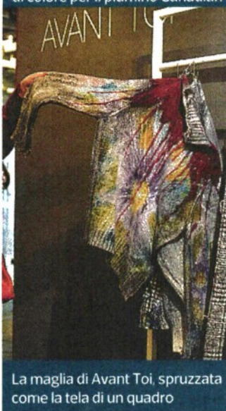
La maglia di Avant Toi, spruzzata come la tela di un quadro