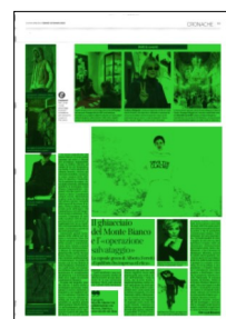
Superficie 92 %

Gian Luca Bauzano © RIPRODUZIONE RISERVATA