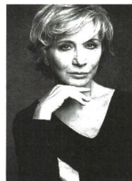
Alberta Ferretti ha ricevuto nel '19 l'Ethical & Sustainable Award