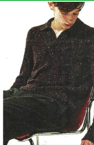
La nuova maglieria di Scaglione