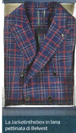
La Jacketinthebox in lana pettinata di Belvest