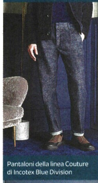
Pantaloni della linea Couture di Incotex Blue Division