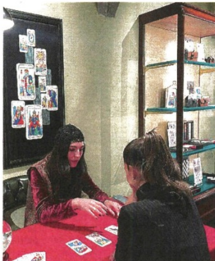
Esperti di tarocchi e numerologi all'evento di Pineider ieri sera per l'inaugurazione della sua boutique fiorentina su Lungarno degli Acciaiuoli con nuovi spazi dedicati al gioco e alle passioni: dalle carte, al golf e tennis, ma anche accessori per escursioni e pic nic.