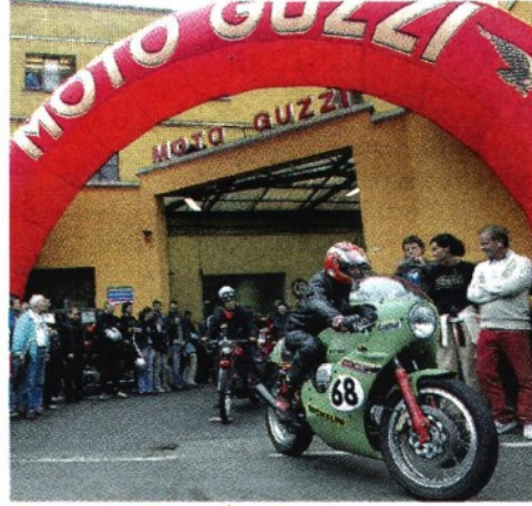
Le GMG avranno luogo tra il 9 e 12 di settembre