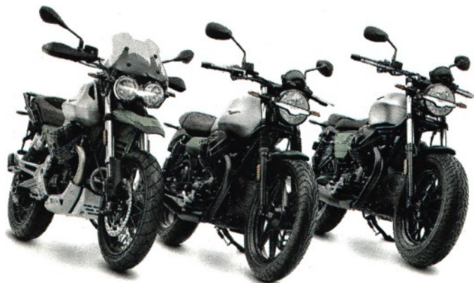
La livrea Centenario di V7, V9 e V85 TT riprende i colori della Otto Cilindri del 1955