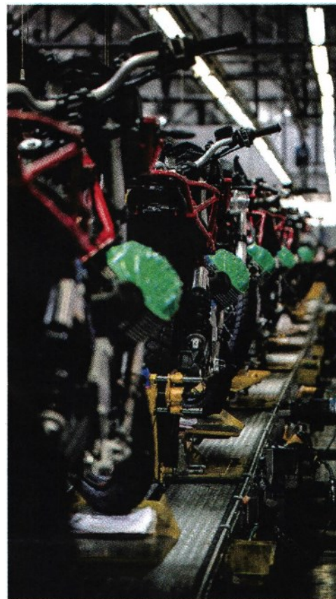
Da sempre la sede produttiva delle Guzzi è a Mandello

8865 - ARTICOLO NON CEDIBILE AD ALTRI AD USO ESCLUSIVO DEL CLIENTE CHE LO RICEVE