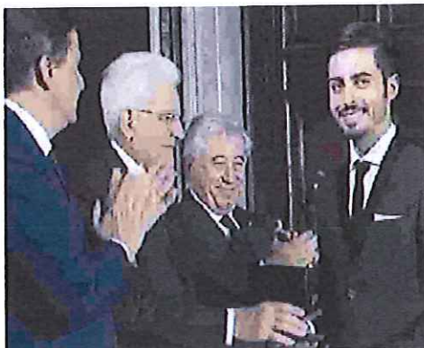
TRINITAPOLI Di Lollo premiato da Mattarella

Fondazione Agnelli realizza ogni anno in Italia, in relazione agli iscritti al primo anno di università, al fine di individuare le scuole superiori che forniscono agli studenti la preparazione più adeguata per affrontare con successo il proprio percorso di studi basandosi sulle informazioni provenienti dagli atenei (banca dati dell'Anagrafe nazionale degli studenti universitari).