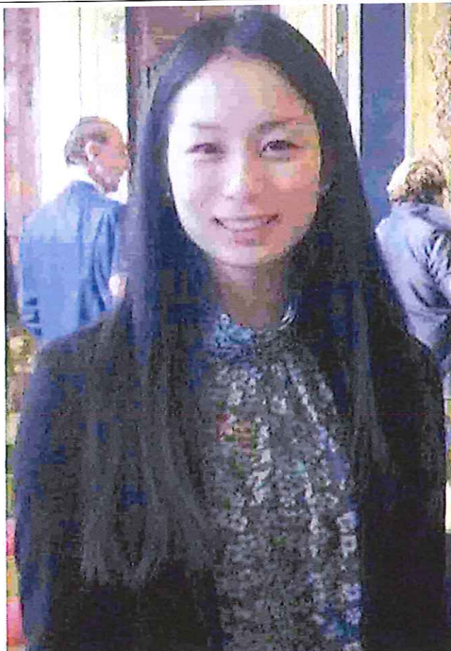
La studentessa di Pontedera al Quirinale