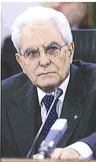
PRESIDENTE Sergio Mattarella