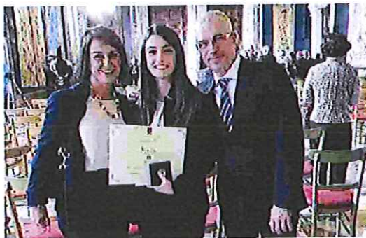
CON I GENITORI La ragazza premiata

gere la mano al Presidente. Nei momenti precedenti a quello io, con i miei compagni, ci siamo confrontati con diverse personalità che ci hanno trasmesso, con i loro complimenti, l'importanza che oggi viene data all'impegno e alla dedizione in Italia". Il riconoscimento di alfiere del lavoro è arrivato per meriti scolastici, essendosi diplomata al liceo "Da Vinci" di Fasano con una media del qua-