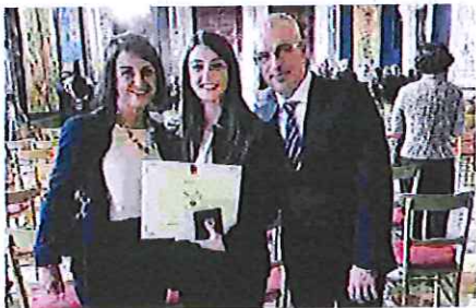
CON I GENITORI La ragazza premiata

Chirurgia all'Università di Bologna – conclude Olive – da circa un mese. Al momento il mio sogno nel cassetto è quello di concludere questa facoltà nel migliore dei modi. Non so cosa vorrei fare dopo o meglio lo so, ma non sono certa che la mia idea non cambierà nel corso degli anni. Per ora mi piacerebbe lavorare nelle sale operatorie, come chirurgo. Sì, penso che sia questo il mio sogno nel cassetto per ora: avere un lavoro che mi appaghi ogni giorno ed essere felice”.