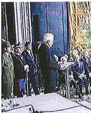
Mattarella durante la cerimonia